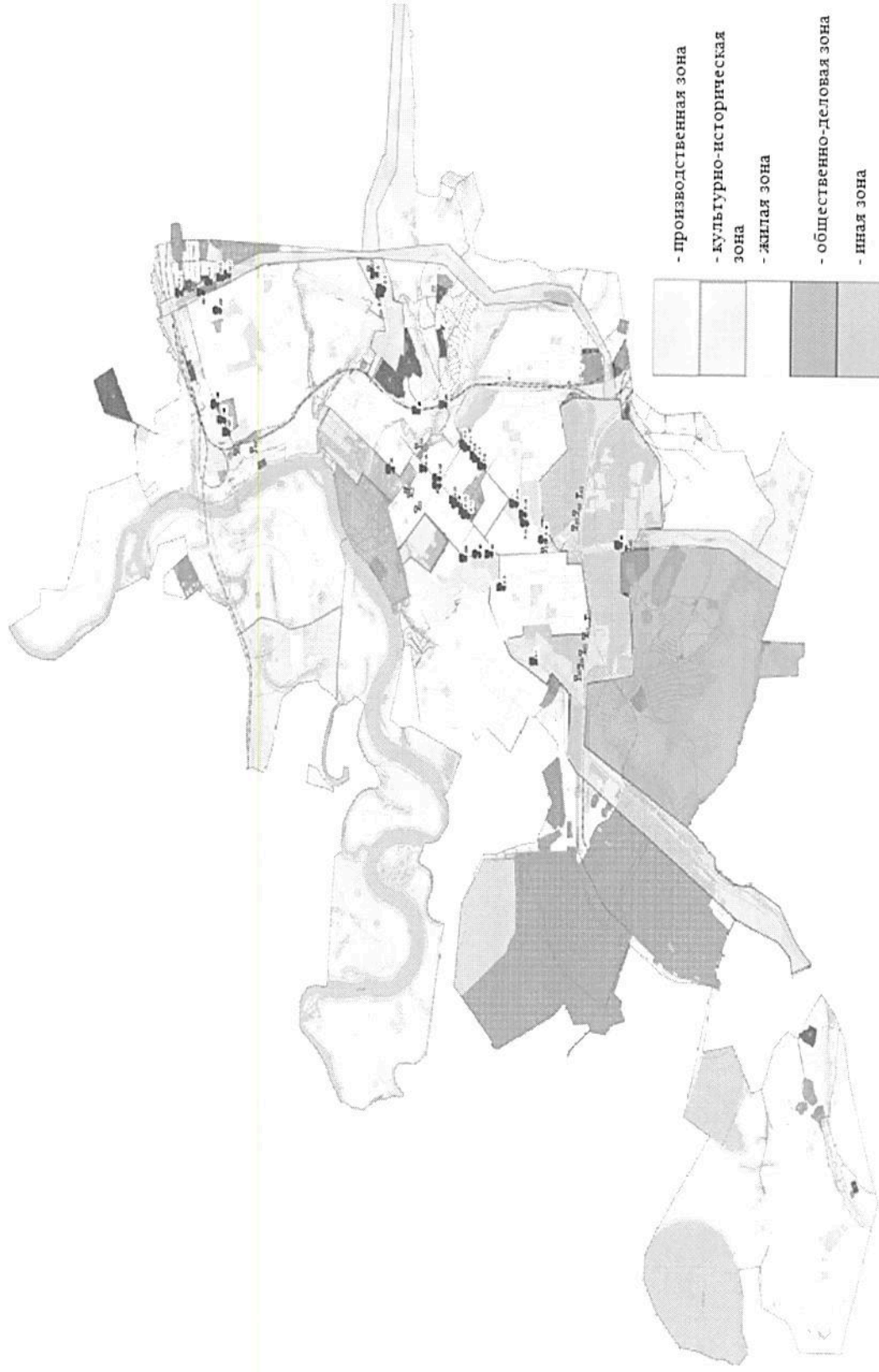
Схема размещения рекламных конструкций на территории муниципального образования город Ачинск